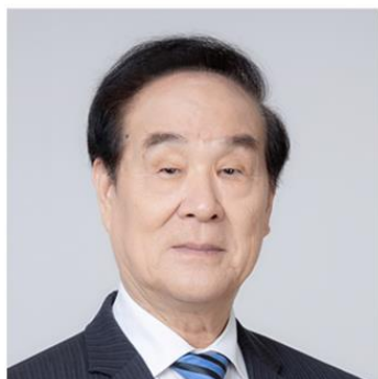
刘庭芳 国际医疗质量与安全 科学院终身院士