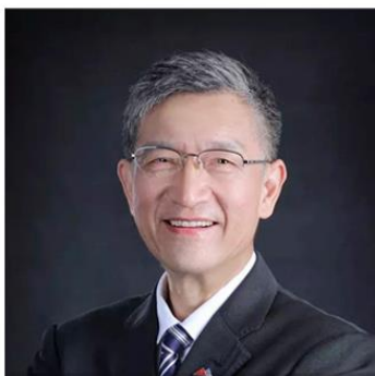
励建安 美国医学科学院 国际院士