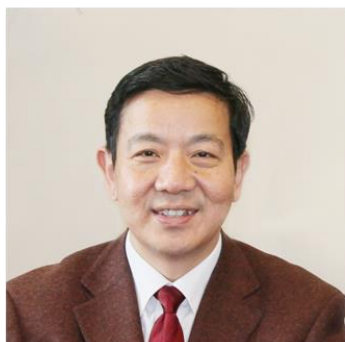
陈勇 北京朝阳医院执行 院长、党委副书记