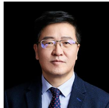
燕继荣 北京大学 政府管理学院院长